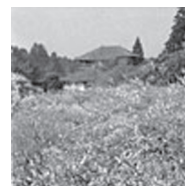
日本三公園のひとつで1842年に水戸藩第9代藩主徳川斉昭により造園された偕楽園