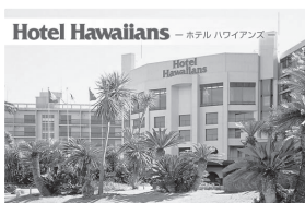
映画フラガールの舞台にもなったスパリゾートハワイアンズ。東京ドーム6個分の常夏パラダイスでフラ体験をしていただけます。