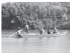
江戸時代初期、地元住人専用で幕府が設けた矢切の渡し。都内で残っているのはここだけ。