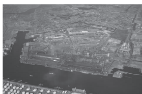
従業員数約3000人、敷地面積約1000万㎡を誇る昭和43年12月1日開設の住友金属鹿島製鉄所様