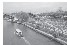
潮来水郷めぐりでサッパ舟と呼ばれる船に乗って水郷情緒を味わいます。