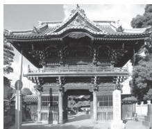
映画の中で寅さんが産湯をつかったという御神水がある柴又帝釈天