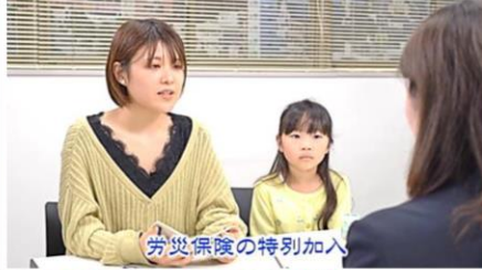
友人の社労士に相談する母娘