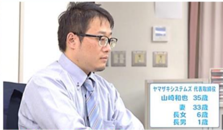
この後 事故に遭う社長