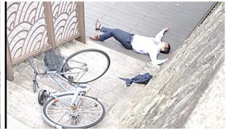
自転車で移動中に河川敷に転落