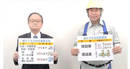
悲劇脱出のための特別加入ができる方