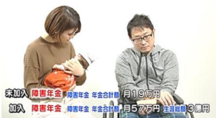
特別加入すれば障害年金も充分