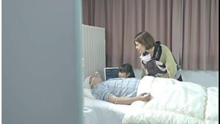
意識不明で病院に搬送。大手術に