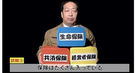
誤解3 保険はたくさん入っている