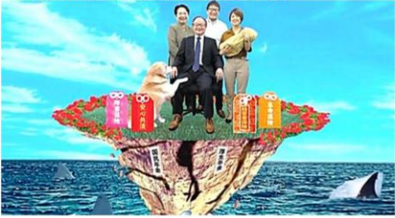
労災保険の未加入はこんな状態