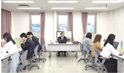
「プロローグ」社長「オレ保険使えないの？」