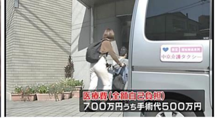
半年後に退院するも第1級障害者に