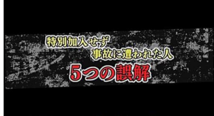
こんな誤解で入らずに悲劇に遭った