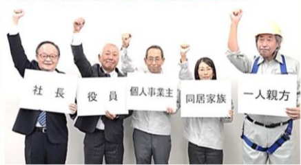
特別加入の有無が私と家族の運命を分ける エピローグ 社長も安心、社員も安心