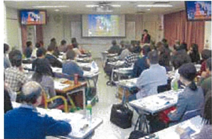
スライドを多用した講義(受験対策講座・以下同じ)