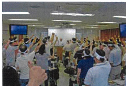
鉢巻締めて「合格するぞ!」(直前講座)