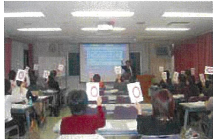
〇×クイズ形式による確認問題。全問正解は賞品も