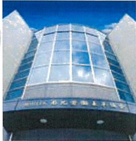
会場の名北労働基準協会会館