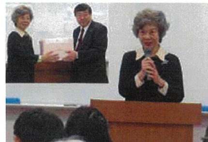
合格者への記念品授与と合格スピーチ