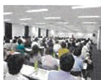
合格者が無料で参加できる 年5回開催の弁護士による 労働問題セミナー

労働基準協会合同開催講習等に無料、会員価格で参加でき、各種会合での合格者間の情報交換も可能です。