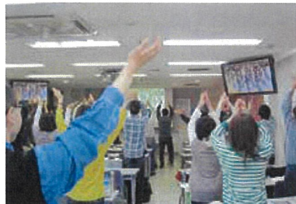
午前・午後2回の体操