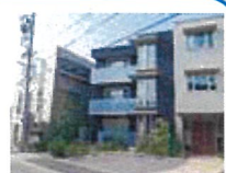
名北協会東隣の、社会保険 労務士法人愛知労務管理 コンサルティング

労働基準協会関連の社会保険労務士法人より、期間臨時職員または紹介の形で業務を依頼します。