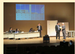
取引先に街宣車を仕向けられ会社は窮地に陥る