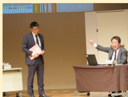
上司から激しい罵声を浴びる労働者