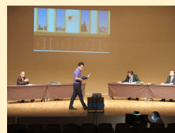
ユニオンとの団体交渉