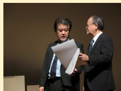
突然ユニオンからの団体交渉を迫られ戸惑う管理職