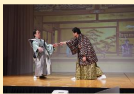
將軍綱吉は、何ら調査もせず浅野を即日切腹としたが、自らの評判が悪くなり、赤穂浪士の討ち入りを手助けする。