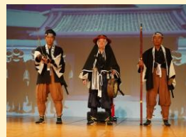
運命の日、12月14日。赤穂浪士四十七士が吉良邸前に集結する。