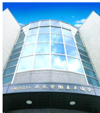
愛知県下の企業勤労者等の皆様が、年間約1万人受講される会場です。