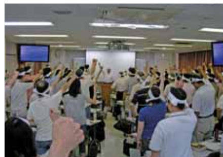
鉢巻締めて「合格するぞ!」(直前講座)