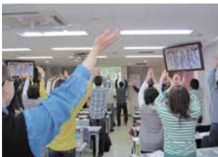
午前・午後2回の体操