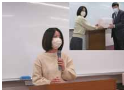
合格者への記念品授与と合格スピーチ