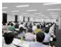
合格者が無料で参加できる 年5回開催の弁護士による 労働問題セミナー

労働基準協会合同開催講習等に無料、会員価格で参加でき、各種会合での合格者間の情報交換も可能です。