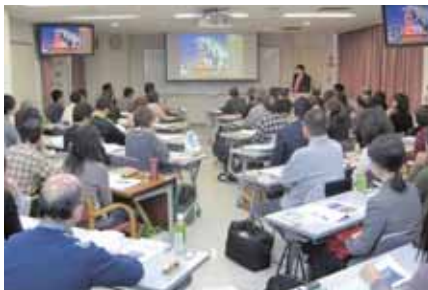
スライドを多用した講義(受験対策講座・以下同じ)