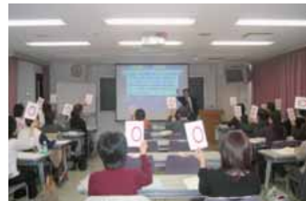
〇×クイズ形式による確認問題。全問正解は賞品も