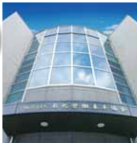
会場の名北労働基準協会会館