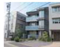
名北協会東隣の、社会保険労務士法人愛知労務管理コンサルティング

労働基準協会関連の社会保険労務士法人より、期間臨時職員または紹介の形で業務を依頼します。