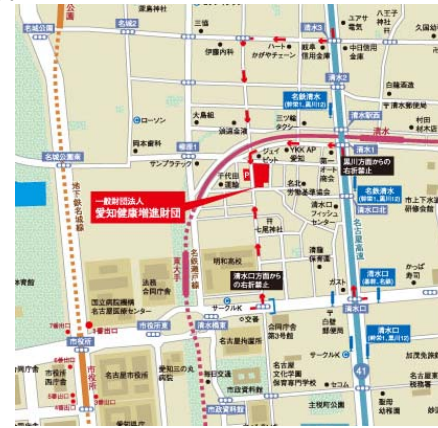
(一財)愛知健康増進財団