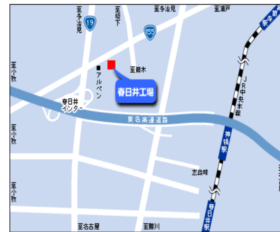
春日井会場 ㈱ファインシンター春日井工場様

(注) 春日井会場は春日井支部役員 ㈱ファインシンター春日井工場 様のご厚意により お借りして おります。