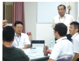
平成25年度 スピーチ力養成夜間講座より

サポートプロジェクトHAYASHI代表。 日本メンタルヘルス協会公認心理カウンセラー・RSTトレーナー。 三友工業株式会社に長年にわたり総務部長や本社の執行役員等として勤務し、この間社内、社外における人材育成を行うとともに、各種講演活動や司会も行いスピーチ力を武器に第一線で活躍。その後独立し、日本メンタルヘルス協会公認心理カウンセラーも取得しプロとして企業、行政、学校等での幅広い講演活動を精力的に行う。