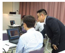
平成25年度 パワーポイント作成夜間講座より

CBC関連会社である(株)CBCクリエイションの営業企画部、CGデザイン部勤務を経て、現在に至る。営業企画部在籍時にはプレゼンテーション用の実践的な技術を、CGデザイン部異動後は、デザイナーとしてのスキルを身につける。テレビの「伝える」現場で身につけたパワーポイントの基本を分かりやすく解説する。