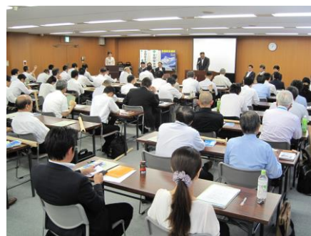
会場の様子(平成25年度)