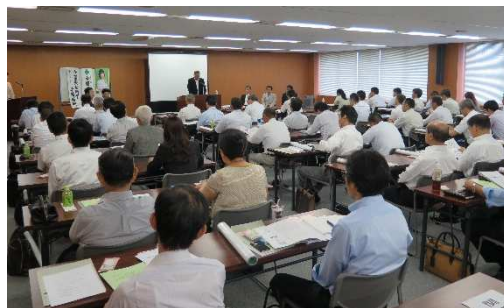
会場の様子(平成27年度)