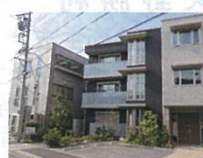
名北協会東隣の、社会保険 労務士法人愛知労務管理 コンサルティング

名北協会関連の社会保険労務士法人より、期間臨時職員または委任の形で業務を依頼します。