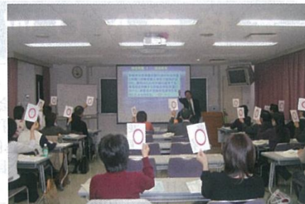
○×クイズ形式による確認問題。全問正解は賞品も