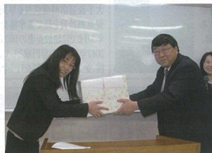
合格者への記念品授与と合格スピーチ