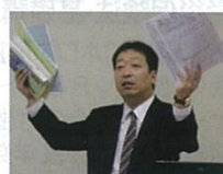
労災保険問題は何でも お任せ下さい。 労災保険法 石田講師

勤務・開業社会保険労務士として直面する、業務上の課題の相談、情報・資料の収集が可能です。