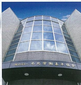
会場の名北労働基準協会会館