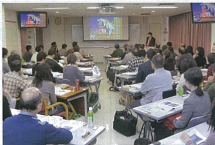
スライドを多用した講義(受験対策講座・以下同)