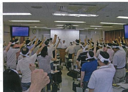
鉢巻締めて「合格するぞ!!」(直前講座)