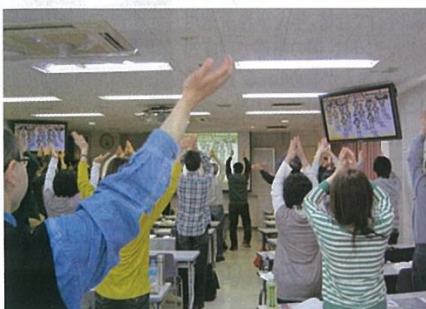
合間の体操。曲は資格ゲットを目指しフライングゲット