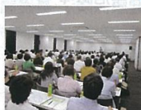
合格者が無料で参加できる 年5回開催の弁護士による 労働セミナー

労働基準協会合同開催講習等に無料、会員価格で参加でき、各種会合での合格者間の情報交換も可能です。