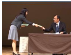
幕間の新美産業カウンセラー解説