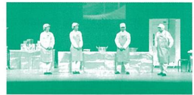
まさかパワハラ加害者になるなんてより