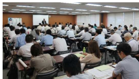
前年度 名古屋会場の様子