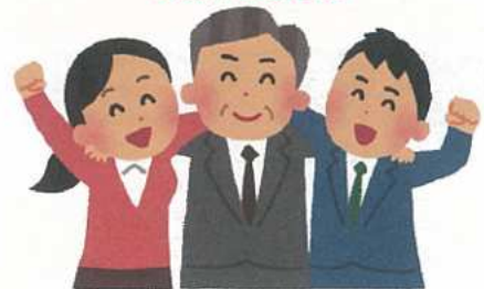
定年後再雇用時の賃金割合について