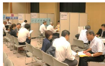
平成29年9月開催の機関展 11機関が出展し60企業が参加

そこで、このような人材専門機関と企業との出会いの場として、 人材紹介・派遣・受入機関展 を開催いたします。ぜひともご参加いただきますようご案内申し上げます。