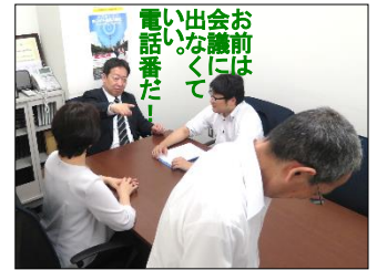
人間関係切り離し