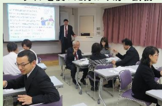
3択問題を考えるグループ討議