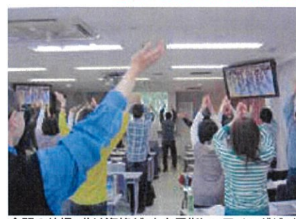
会場の体操。曲は資格ゲットを目指しフライングゲット