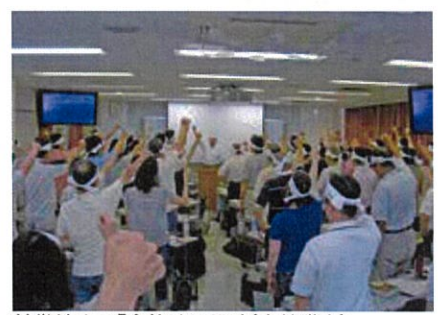
鉢巻締めて「合格するぞ!」(直前講座)