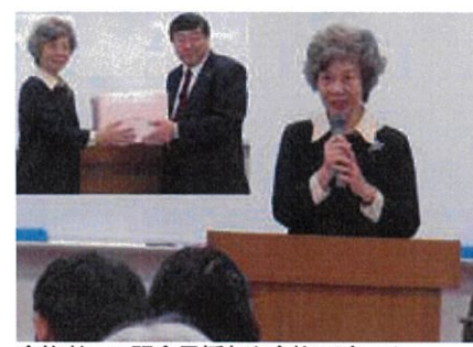
合格者への記念品授与と合格スピーチ