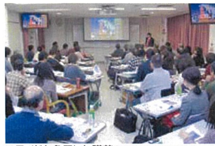
スライドを多用した講義(受験対策講座・以下同じ)