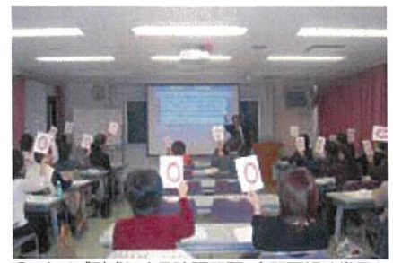
○×クイズ形式による確認問題。全問正解は賞品も