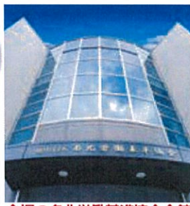
会場の名北労働基準協会会館