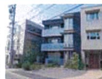
名北協会東隣の、社会保険労務士法人愛知労務管理 コンサルティング

名北協会関連の社会保険労務士法人より、期間臨時職員または紹介の形で業務を依頼します。