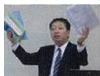
労災保険問題は何でも お任せ下さい。 労災保険法 石田講師

勤務・開業社会保険労務士として直面する、業務上の課題の相談、情報・資料の収集が可能です。