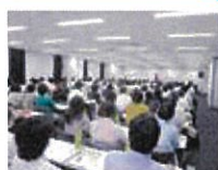
合格者が無料で参加できる 年4回開催の弁護士による 労働問題セミナー

労働基準協会合同開催講習等に無料、会員価格で参加でき、各種会合での合格者間の情報交換も可能です。