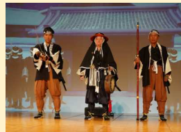
運命の日、12月14日。赤穂浪士四十七士が吉良邸前に集結する。