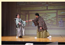
將軍綱吉は、何ら調査もせず浅野を即日切腹としたが、自らの評判が悪くなり、赤穂浪士の討ち入りを手助けする。