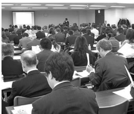
大変盛況な説明会会場 (名古屋栄ビルディング)

続いて、同署多賀第四方面主任監督官が「賃金の支払等に関する留意点について」、割増賃金や休業手当などの法律に定められた基準について説明を行った。なお、同説明会は管内事業場に対して無料で実施された。