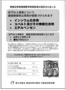
厚生労働省発行パンフレット