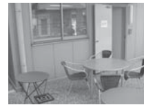
屋外休憩所(喫煙コーナー)