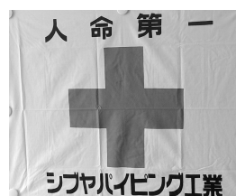
自社で使用している安全旗