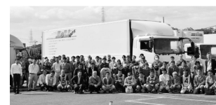
事故ゼロを目指しておこなわれる 「トラックドライバーコンテスト」から