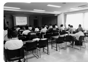
毎月実施している安全衛生推進会議