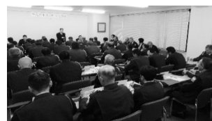
警備隊長会議(社長訓示)