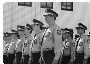
警備員の整然とした隊列風景