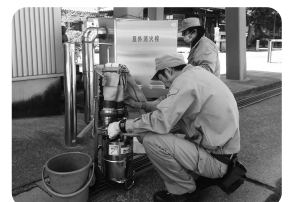
安全第一で屋外消火栓の点検作業