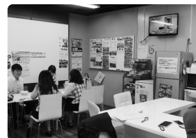
従業員休憩スペース コミュニケーションルーム「サロンドK」