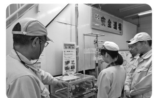
安全道場 巻込まれ体験