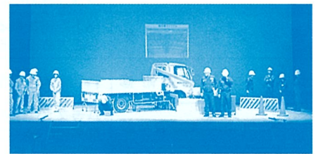
波紋 ある工場の悲劇より