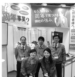
展示会に出展する周年事業のメンバー