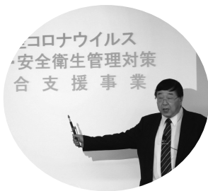
市之瀬専務理事・事務局長