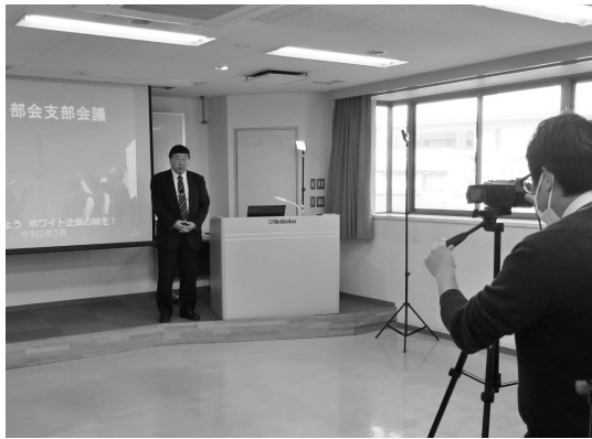
ホームページ掲載用「議案説明」動画撮影の様子