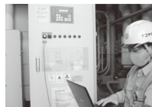
空調熱源機保守点検