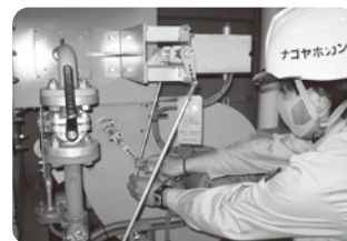
燃焼機器チューニング