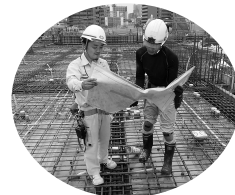
小学校の新築工事で自社の現場担当員(施行管理)と図面確認する協力会社社員