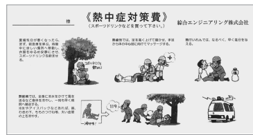
熱中症対策費配布用、救急措置法を印刷した封筒