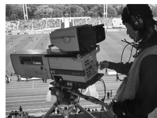
競技場カメラマン