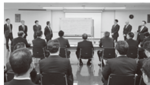
2020年1月「新年会議」にて、「今後の人材育成」をテーマに本社・工場の管理職で議論・発表を行いました