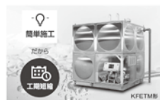
ステンレス製で清潔給水 超省エネ・省スペースのステンレス製 水槽一体型給水ポンプユニット