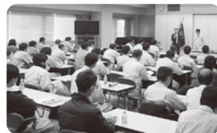
特別教育の様子(2019年撮影)