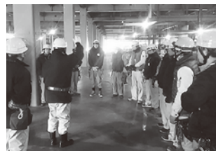
大津社長によるパトロール(2019年 撮影)