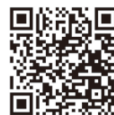
最低賃金を引き上げた中小企業における雇用調整助成金等の要件緩和