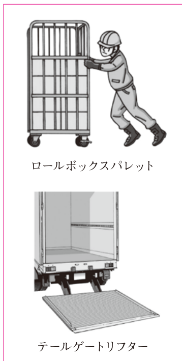
ロールボックスパレット