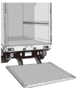
テールゲートリフター