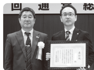
理事長と永年勤続表彰者との記念写真