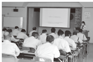
管理職対象「ハラスメント管理者講習」

社員のプライベートを充実させる取り組みとして、毎週水曜日と金曜日は「ノー残業デー」として社員が定時で退社することを促し、プライベートを充実させ仕事とのメリハリをつけることでワーク・ライフ・バランスを改善する取り組みを実施しています。