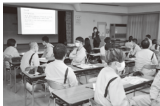
若手社員対象「メンタルタフネス講習」