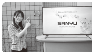
「ホワイト企業推進事業場之証」と当社管理部社員