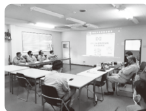
連休前の安全連絡会議