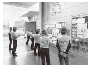
全社安全衛生委員会 社長・役員安全巡視