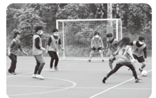
福利厚生施設 社内イベント