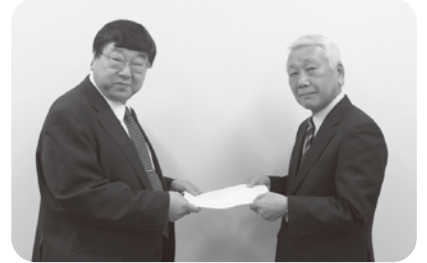
ふく田社会保険労務士事務所 福田所長(右)、当協会 市之瀬専務理事・事務局長(左) =ネクストイノベーション 株式会社様ご紹介(13社目)=