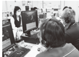
ドライブレコーダー映像監査