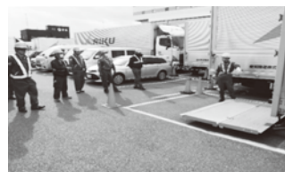
テールゲートリフター特別教育より実 技の禁止操作見本、安全確認方法