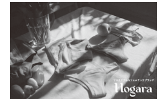
当社が立ち上げたフェムテックブ ランド「Hogara」