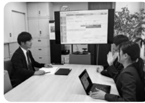
「育児休業前面談」実施の様子

育児休業の取得期間を「子が4歳になるまでの間で最大2年間」とし、社員の状況に合わせて取得できる環境を整えています。休業前には本人・上司・人事の三者面談を実施し、休業中・復帰時に利用可能な制度を紹介することで、本人が休養に専念できる環境・復帰しやすい風土づくりをサポートしています。また、法定を上回る育児制度(有給での短時間勤務制度、子が3歳を迎えた後も利用可能なフレックス勤務制度)を整備し、子育てをしながら柔軟に働き続けられる職場を目指しています。