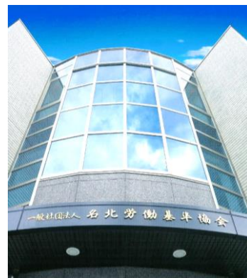
愛知県下の企業勤労者等の皆様が、年間約1万人受講される会場です。