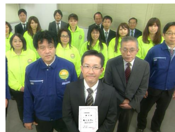
労務管理で頑張る企業の“証”です