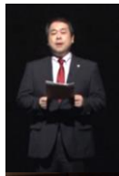
幕間の庄司弁護士解説

「お金なんていらぬ。元気な夫を返して」亡くなった労働者の妻の言葉が、専務の胸に突き刺さる。