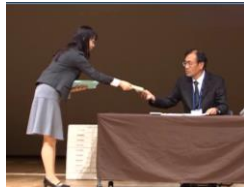
幕間の新美産業カウンセラー解説